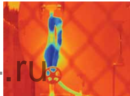
Fluke LaserSharp™ Auto Focus фиксирует именно то, что вам нужно. ВСЕГДА БЕЗ ИСКЛЮЧЕНИЯ

Каждый, кто пользуется тепловизорами, знает, что при проведении инфракрасного контроля единственным действительно важным критерием является фокусировка. Если изображение не сфокусировано, погрешность измерения температуры может составить до 20°, что помешает обнаружить проблемы при контроле. Именно поэтому компания Fluke разработала единственные на рынке тепловизоры с системой LaserSharp™ Auto Focus—для стабильно сфокусированных изображений. ВСЕГДА БЕЗ ИСКЛЮЧЕНИЯ Оптимальная гибкость фокусировки обеспечивается за счет другой опции — системы фокусировки IR-OptiFlex™ Focus System, в которой функция ручной настройки сочетается с простотой использования.