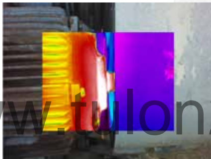
Ti400 Кадр в кадре, высокого контраста, электродвигатель с перегретыми подшипниками