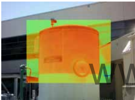
Ti400 Кадр в кадре, AutoBlend, уровень жидкости в промышленном баке