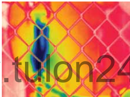
Пассивные системы автоматической фокусировки могут фиксировать только близлежащие объекты