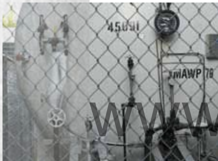
Тяжелые условия контроля